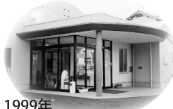
1999年 コープみんなの診療所