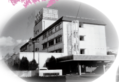
1989年 岡山東中央病院