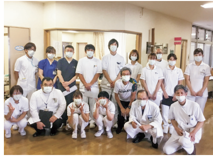
コロナ患者を受け入れるチームを発足