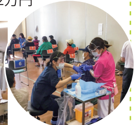
医療生協で延べ29,000回以上のワクチン接種を実施

これまでのご支援に心よりの御礼とともに、誰一人取り残さない医療・介護を行うために、これからの活動も引き続きご支援のほどよろしくお願いいたします。