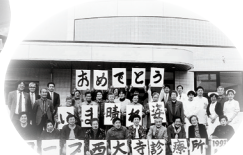
1989年 せいきょう玉野診療所